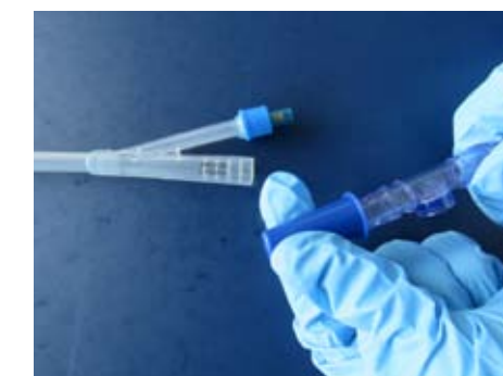
(tappo della nuova sacca)