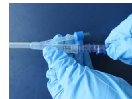
(inserimento della nuova sacca) Fig. 6